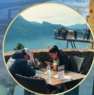
哈德昆观景平台 全景餐厅三道式