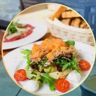
阿莱奇冰川三道式餐

阿莱奇冰川三道式、铁力士山顶餐厅三道式+奶酪火锅 哈德昆观景平台全景餐厅三道式、日内瓦游湖午餐、西庸城堡品酒