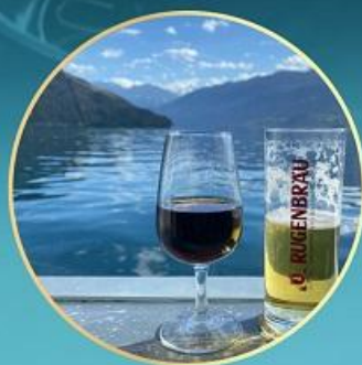
日内瓦湖游船午餐