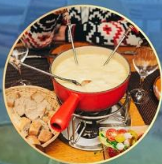
铁力士山顶餐厅三道式 瑞士国菜奶酪火锅